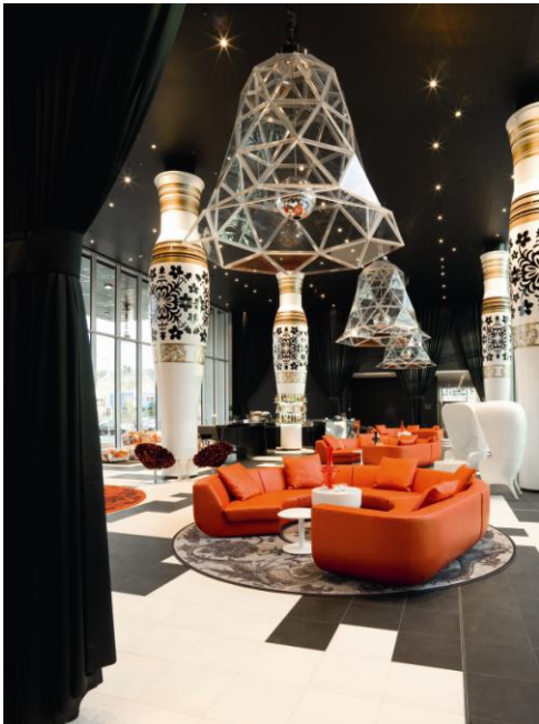
Marcel Wanders, The Kameha Grand Bonn Hotel, Bonn, 2010.

Een bekende uitspraak: 'Less is more' . Marcel Wanders zegt: 'Meer is meer' 15 . Wat vind jij? Mag het wel iets minder, om één ding sterker te laten uitkomen, of ben je eens met Marcel Wanders dat het niet gek genoeg kan zijn?