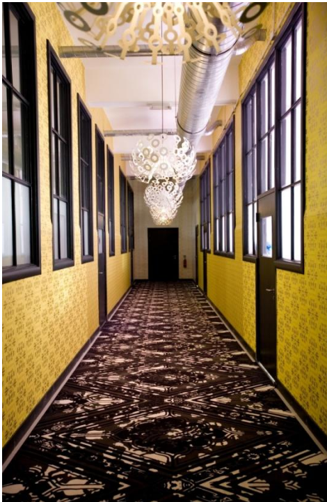
Marcel Wanders, Interieur Westerhuis, Amsterdam, 2008.

De interieurs die Marcel Wanders ontwerpt zijn vaak overweldigend, rijk gevuld met uitbundige patronen en objecten 14 . Kijk bijvoorbeeld maar eens naar de onderstaande interieurfoto's.