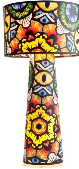
Marcel Wanders, Eye Shadow , 2013.