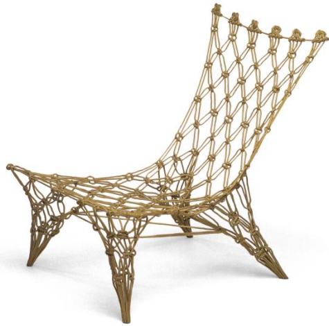
Marcel Wanders, Knotted Chair (prototype no. 5), 1995-1996, Collectie Stedelijk Museum Amsterdam.

Marcel Wanders werd beroemd met zijn ontwerp van de Knotted Chair (1995-1996) - onder andere aangekocht door het Stedelijk en het MoMA - voor het ontwerpplatform Droog. Droog is opgericht om Nederlandse ontwerpers van Dutch Design* in het buitenland te promoten. Wie met Droog samenwerkt, maakt vaak functionele ontwerpen die tegelijkertijd een commentaar vormen op de hedendaagse cultuur. Wanders past helemaal in deze lijn, met zijn nadruk op het persoonlijke en de gevoelswaarde van een object. Zoals de ontwerper in de uitzending zelf aangeeft, is 'vorm versus functie' een van de grote dogma's* in design.