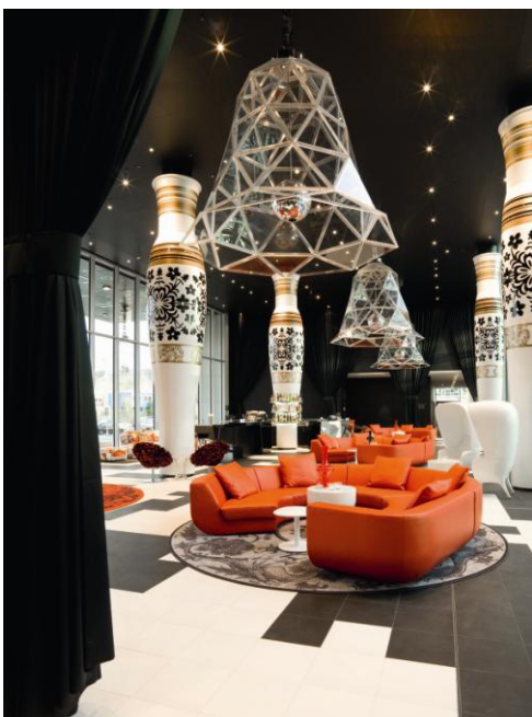
Marcel Wanders, The Kameha Grand Bonn Hotel, Bonn, 2010.

Een bekende uitspraak: 'Less is more' . Marcel Wanders zegt: 'Meer is meer' 15 . Wat vind jij? Mag het wel iets minder, om één ding sterker te laten uitkomen, of ben je eens met Marcel Wanders dat het niet gek genoeg kan zijn?