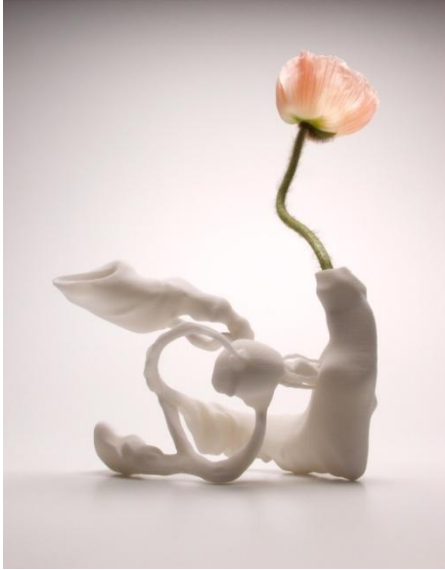
Marcel Wanders, Airborne Snotty Vase Ozaena , 2001, Collectie Stedelijk Museum Amsterdam.

Voordat Wanders tot het uiteindelijke ontwerp komt, maakt hij een hele hoop schetsen, lijstjes en teksten van alle mogelijkheden in zijn hoofd: de ontwikkelingsfase. Uit al die ideeën selecteert hij een aantal goede schetsen om vervolgens prototypen* te maken. In het hele proces maakt Wanders voortdurend afwegingen – welk model is verfrissender, origineler, doet meer met je? Alle elementen moeten perfect samen gaan. 10 Wanders gaat net zo lang door met kijken, denken, schetsen en prototypen maken, tot hij de perfecte samenstelling van alle elementen krijgt: het moet voldoen aan wat de opdrachtgever gevraagd heeft, maar ook aan zijn eigen visie: een combinatie van heden en verleden, duurzaamheid, verrassend, vernieuwend, persoonlijk en humaan.