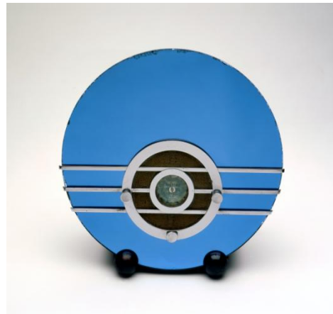
Walter Dorwin Teague, Bluebird , 1934, Collectie Stedelijk Museum Amsterdam.

In de jaren 30 bedachten Amerikaanse fabrikanten samen met ontwerpers de Streamline-stijl. Door de vorm van de producten sneller en dynamischer te maken, hoopten de fabrikanten meer te verkopen. De stijl was in het begin niet gericht op technische verbetering van producten, alleen op het veranderen van vorm. 12 De fabrieken produceerden in deze tijd zoveel dat grote voorraden ontstonden. In het plaatje hieronder zie je een radio, de Bluebird , in Streamline-stijl. Kun je overeenkomsten vinden met Wanders' visie op design? En verschillen?