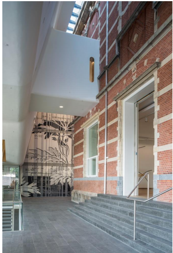
Stedelijk Museum Amsterdam.