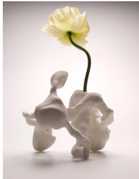
Marcel Wanders, Airborne Snotty Vase Sinusitis , 2001, Collectie Stedelijk Museum Amsterdam.

In het geval van de Airborne Snotty Vases was Wanders op zoek naar een object waarop hij een nieuwe 3D- printtechniek kon testen, iets wat niemand nog van dichtbij had gezien. Zo kwam hij op het snotje dat bij het niezen uit je neus vliegt. Van de snotjesvorm die hij sterk uitvergrootte, maakte hij 3D-prints, gaf er de functie van vaas aan en vernoemde ze naar verschillende virussen. De Airborne Snotty Vase is een typisch Wanders-object, met een vorm zó belangrijk dat je de functie haast vergeet. En wederom met het voor hem kenmerkende contrast tussen de uitvoering, in hypermodern geprint kunststof, en de betekenis van het snotje als iets heel menselijks, persoonlijks en gedetailleerds.