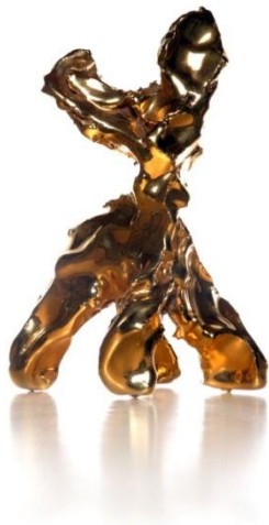
Marcel Wanders, One Minute Sculpture , 2004.