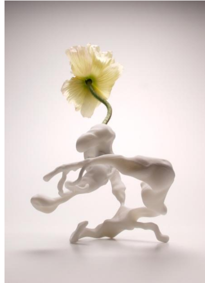
Marcel Wanders, Airborne Snotty Vase Coryza , 2001, Collectie Stedelijk Museum Amsterdam.