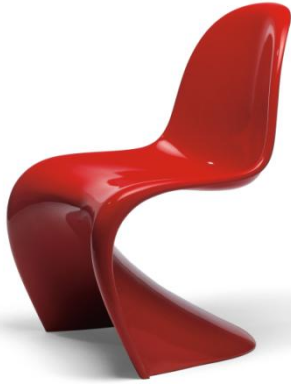
Verner Panton, Panton Chair , ontwerp 1958-productie in deze vorm 1967/1968-1971, Collectie Stedelijk Museum Amsterdam.

laat zien hoe nieuwe productietechnieken kunnen leiden tot een heel nieuw ontwerp, vergelijkbaar met de 3D-print van Marcel Wanders. Toch zijn er ook verschillen met de stijl van Wanders. Kun je één of meer dingen bedenken?